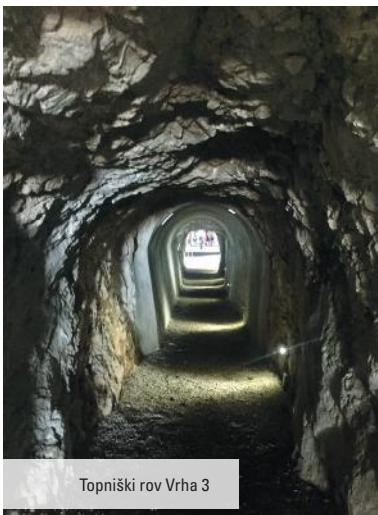
Topniški rov Vrh 3

Muzej prve svetovne vojne na Debeli grizi nudi obiskovalcem s svojimi multimedijškimi interaktivnimi napravami in s svojimi vsebinami v italijanskem in angleškem jeziku posebno doživetje.