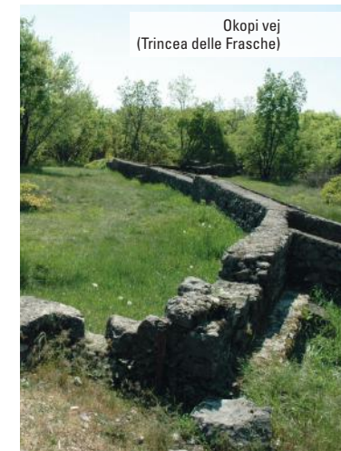
Okopi vej (Trincea delle Franche)

Ob cesti, ki vas bo vodila od Parka Ungaretti proti Martinščini, boste po dveh kilometrih med rastlinjem opazili strelski jarek Frasche . Nedaleč je parkirišče; od tu lahko peš nadaljujete pot po kolovozu preko nedanjenega bojnega polja Area delle battaglie , kjer sta spomenik brigadi Sassari in spomenik Filippu Corridoniju.