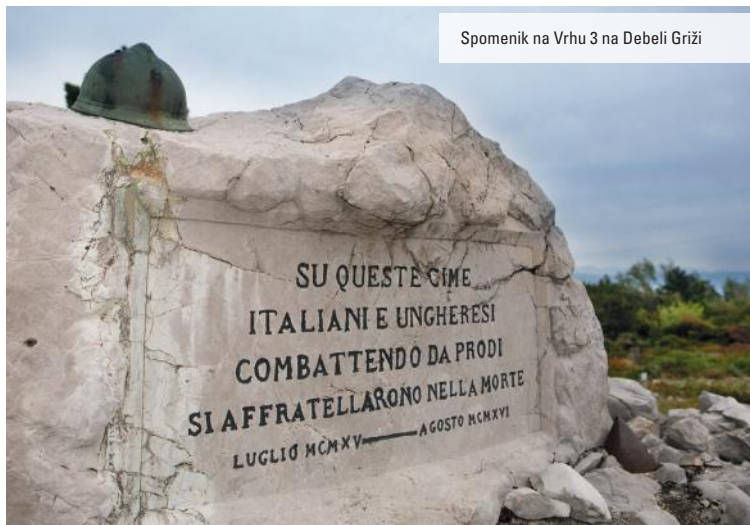
Spomenik na Vrh 3 na Debeli Griži

Tu so vojne ostaline, spomeniki in obeležja posvečeni vojskujočim se enotam, povezovalni in strelski jarki ter podzemni prostori. Če je ogled Schönburgtunnela in kaverne Lukachich možen le od zunaj, lahko obiskovalci vstopijo v topovsko kaverno Vrh 3 v času, ko je multimedijški muzej odprt. Z muzejsko vstopnico in mobilno aplikacijo boste na petih različnih točkah spoznali tudi virtualne vsebine razširjene resničnosti (Augmented Reality – AR+).