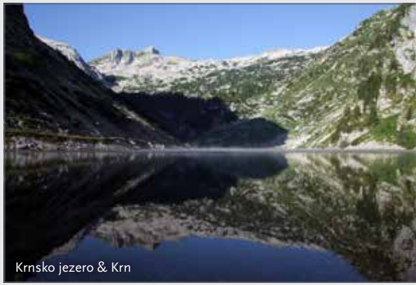
Krnsko jezero & Krn