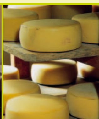
Muzej sirarstva - Kobarid