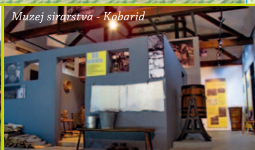
Muzej sirarstva - Kobarid

Zahvala za pomoč: Peter Stres, Boris Knapič, Kobariški muzej, Muzej sirarstva, Fundacija Poti miru, LTO Kobarid, Občina Kobarid, vaščanom Idrskega in Mlinskega.