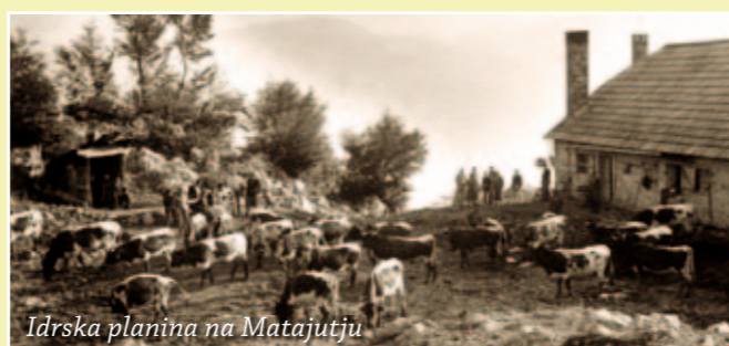
Idrska planina na Matajutju