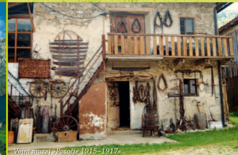
Vojni muzej »Posočje 1915-1917«

In tutti i secoli IDRSKO ha conosciuto il duro lavoro contadino. Ebbero successo soprattutto quelle fattorie, che avevano saputo trovare altre fonti di reddito oltre all'agricoltura e all'allevamento di bestiame. Queste dovevano essere famiglie numerose. Oltre al lavoro, gli abitanti avevano del tempo anche per la cultura e il divertimento. Attraverso la storia Idrsko apparteneva